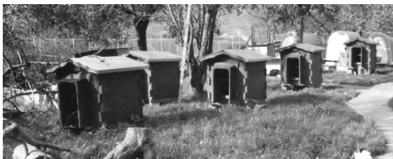
...und Katzenhäuschen hat es zehnmal mehr.